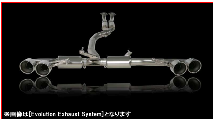
※画像は[Evolution Exhaust System]となります