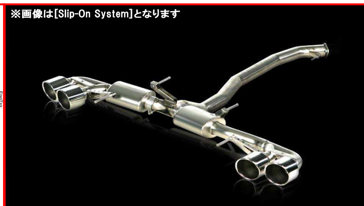
※画像は[Slip-On System]となります

※掲載されているすべての文章、画像の無断転載、転用を禁止させていただきます。ご了承下さい。