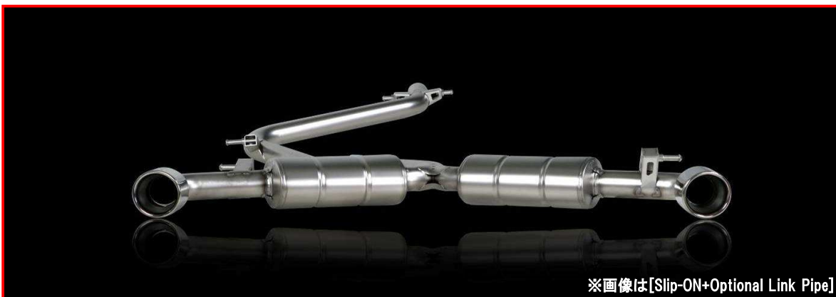
※画像は[Slip-ON+Optional Link Pipe]

※掲載されているすべての文章、画像の無断転載、転用を禁止させていただきます。ご了承下さい。