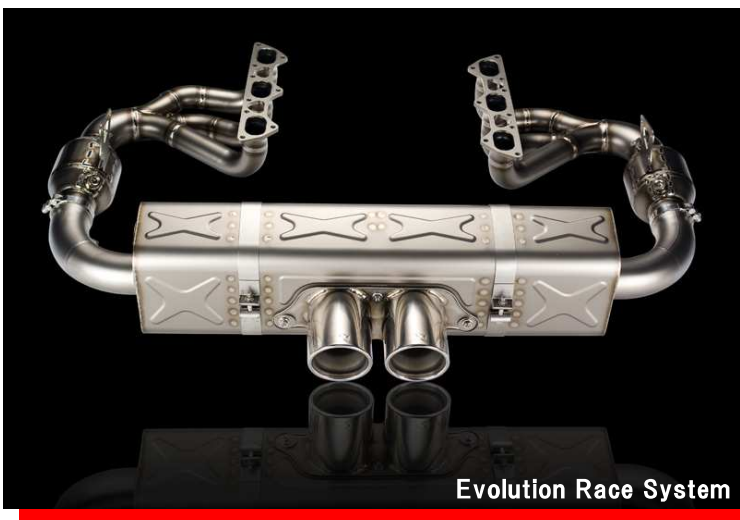
Evolution Race System