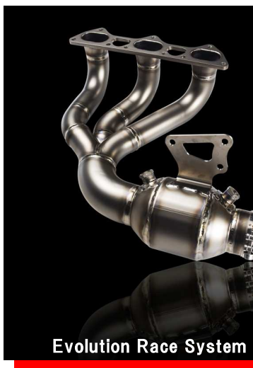
Evolution Race System