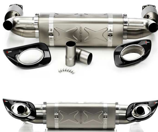
Slip-ON + Link Pipe