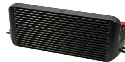
インタークーラー #8115B