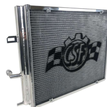
ヒートエクスチェンジャー #8131