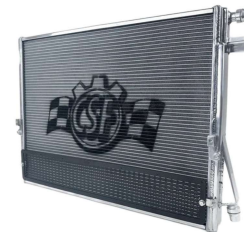
ヒートエクスチェンジャー #8154