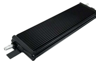
ミッションオイルクーラー #8183