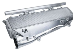
エアクーラーマニホールド #8200