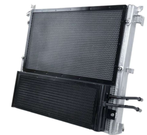
ヒートエクスチェンジャー + ミッションオイルクーラー #8331