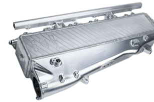
エアクーラーマニホールド #8200