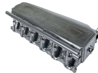
エアクーラーマニホールド #8400