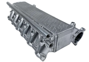
エアクーラーマニホールド #8300