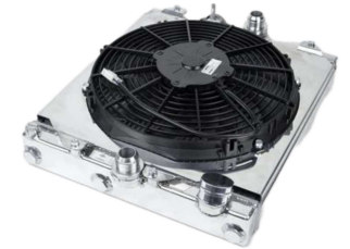
ハーフラジエター #2858X