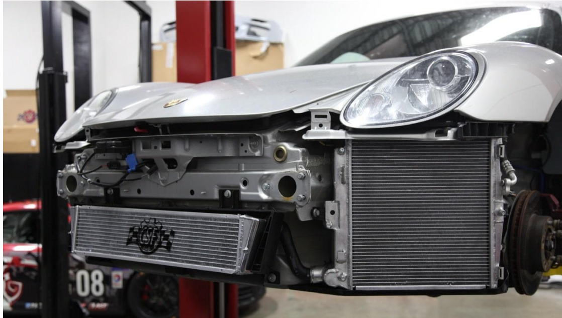
7047 - PORSCHE