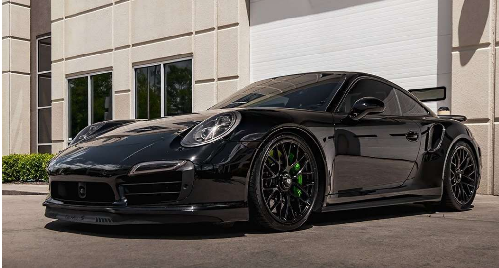
7066 - PORSCHE