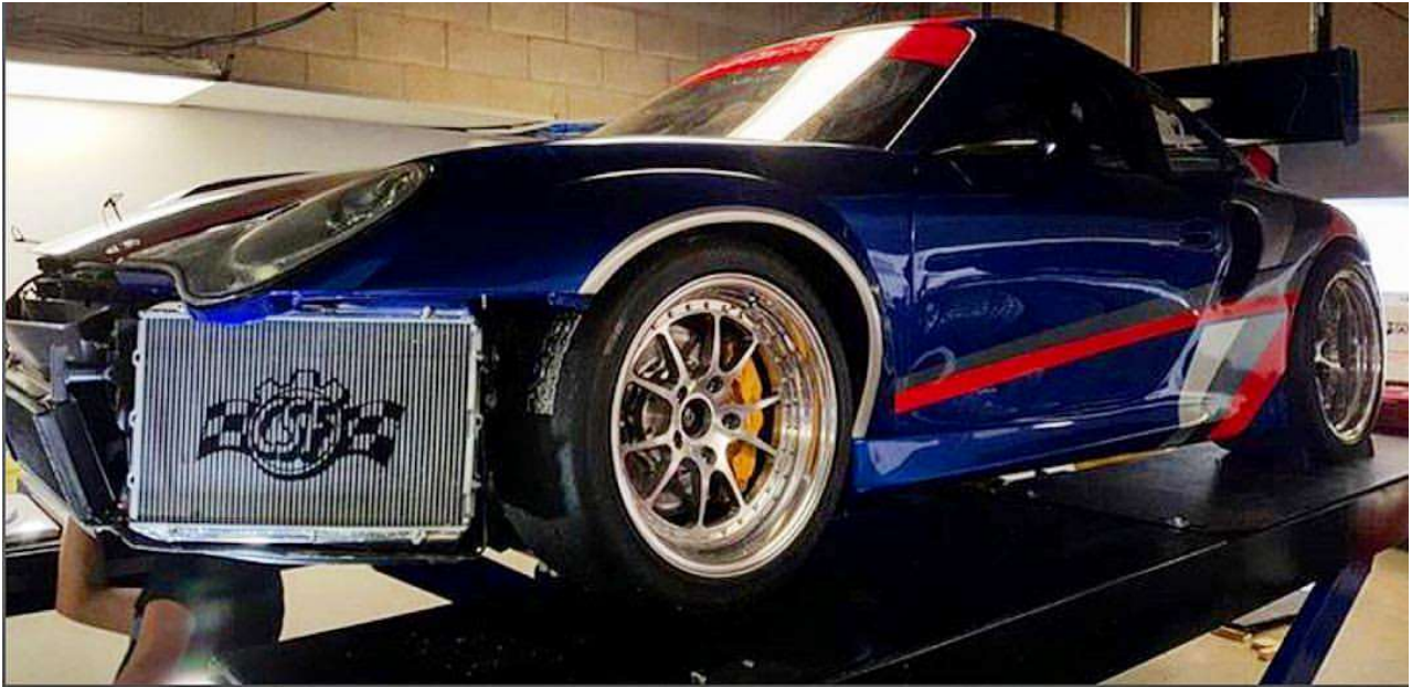
7044 - PORSCHE