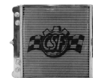
ラジエター(左・右) #7044