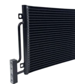
A/C コンデンサー #8381