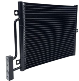
A/C コンデンサー #8381