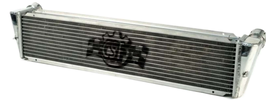
ラジエター(センター) #7049